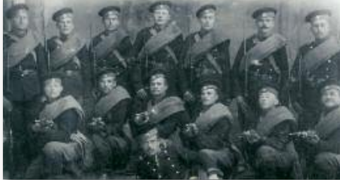
Soldaten der russischen Armee

Demonstration in den 1970-er Jahren gegen die Diskriminierung der Deutschen in der Sowjetunion